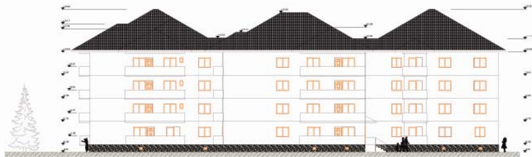
FATADA SUD T1, T2, T3 sc 1:100